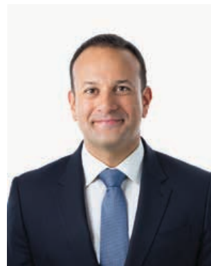
Leo Varadkar TD, An Tánaiste agus an tAire Gnó, Trádála agus Nuálaíochta

Ba mhaith liom buíochas a ghabháil le gach duine a chur leis an doiciméad seo. Taispeánfaidh sé an bealach.