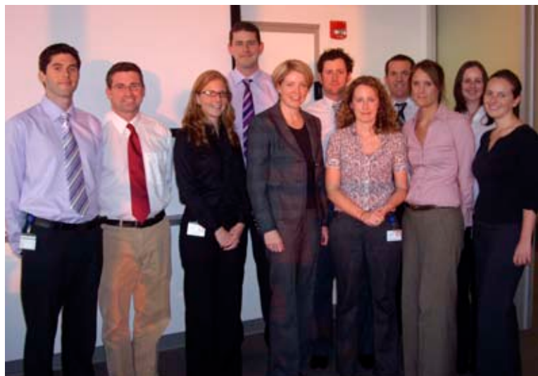
Ceannscríbhinn: Buailéann an Tánaiste agus an tAire Fiontar, Trádála agus Fostaíochta, Mary Coughlan, T.D., leis an bhfoireann ó shaoraíid Chionn tSáile Eli Lilly ar iasacht ó cheanncheathrú chorparáideach na cuideachta in Indianapolis, Indiana, i rith a misean trádála seachtaine d'infheistíocht dhíreach eachtrach sna Stáit Aontaithe.

Leanúint le tionscadail ardcháilíochta um Infheistíocht Dhíreach Eachtrach (IDE) a mhealladh go hÉirinn agus na cuideachtaí atá anseo a dhaingniú i ngeilleagar na hÉireann