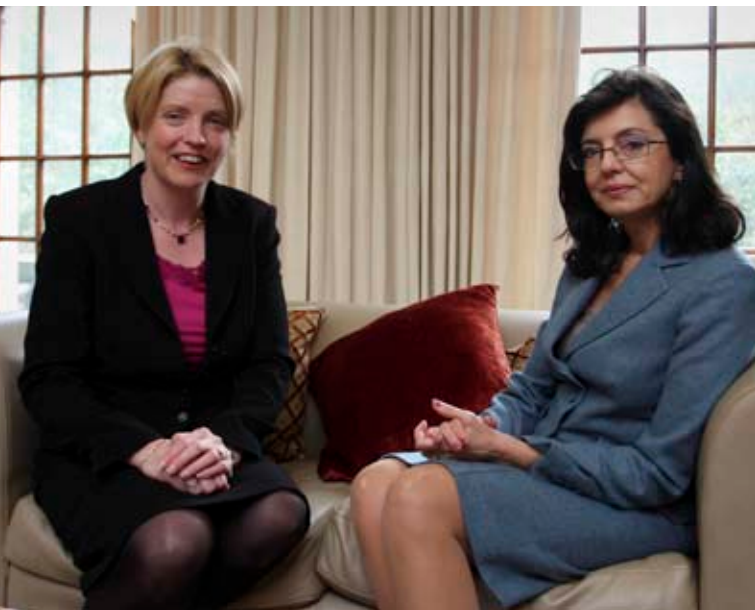
Ceann scríbhinn: An Tánaiste agus Aire Fiontar, Trádála agus Fostaíochta, Mary Coughlan, T.D., agus Meglena Kuneva, Coimisinéir Tomhaltóirí an AE, ag plé nithe maidir le gnóthaí tomhaltóirí.

Ghlac an Roinn le cuireadh ó Choimisiún an AE le haighneachtáil a chur isteach ar a Pháipéar Bán ar Chaingne ar shárú rialacha in aghaidh trustaí an AE. Chuimsigh an Páipéar Bán an áirithe sin moltaí a dearadh le tabhairt faoi chonstaicí ar fhorfheidhmiú príobháideach dlí iomaíochta agus na deacrachtaí a bhain le héilimh a dhéanamh ar dhamáistí.