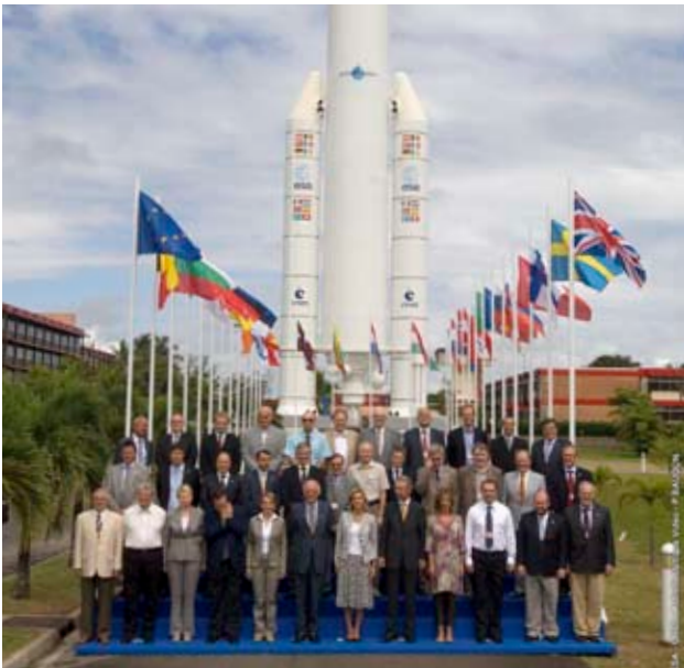
An tAire Eolaíocht, Teicneolaíocht agus Nuálaíocht, An Dr Jimmy Devins, T.D., le baill den Eorpach Spáis na Comhairle i Ghuáin na Fraince.