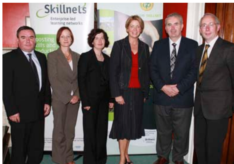
An Tánaiste agus an tAire, Fiontar, Trádála agus Fostaíochta, Mary Coughlan, T.D., ar seoladh Skillnets i ICOS, Teach an Pluincéad, Cearnóg Mhuirfean, Baile Átha Cliath.

I mí na Nollag 2008, d'fhógair an Tánaiste go raibh cinneadh déanta ag an Rialtas leanúint lena chur ar náisiúnaigh ón Rómáin agus ón mBulgáir cur isteach ar chead oibre le bheith rannpháirteach i margadh saothair na hÉireann, ach go dtabharfaí tosaíocht dóibh thar náisiúnaigh ó thíortha lasmuigh den Limistéar Eorpach Eacnamaíoch. Bhí na dúshláin ollmhóra atá anois ann mar thoradh ar an ngéarchéim sa timpeallacht eacnamaíochta domhanda, agus an tionchar díreach a bhí aici ar an margadh saothair ar na tosca a raibh tionchar acu ar an gcinneadh.